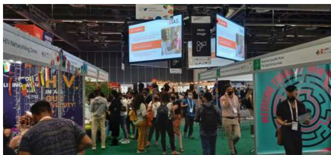
Global Village på 2022 års Världsaidskonferens som detta år hölls i Montreal.

exempel mötte Emanuel Callen-Lorde, en vårdorganisation som speciellt inriktat sig mot HBTQ+ hälsa, i ett digitalt möte den 9 september. Emanuel presenterade sina erfarenheter för styrelse och personal efter hemkomst och höll även en föreläsning på må-bra helgen i Tylösand den 22 oktober.