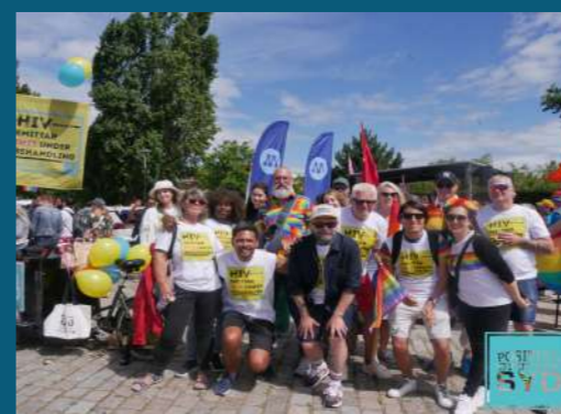
Ett glatt gäng på väg till Malmö Pride!

I den digitala delen av kampanjen publicerade vi en snurrande news-reel film på sociala medier. Filmen innehöll information i bild och text om smittsamhet vid behandlad hivinfektion, samt länkar till Folkhälsomyndigheten och vår egen sida pgsyd.se. Annonser lanserades med flera olika inställningar för att nå ut till en bred publik och för att hjälpa oss att nå ut så effektivt som möjligt. Annonser fick 162 125 exponeringar på Facebook och sågs av 124 063 användare.