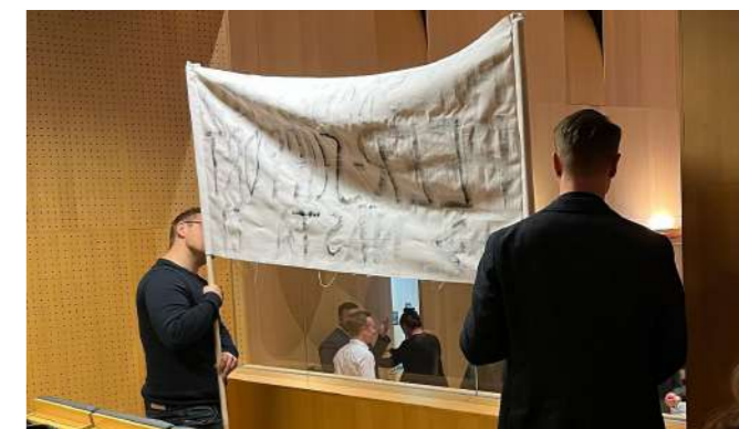
På plats i kammaren på regionfullmäktige i Kristianstad.

I samband med att Regionfullmäktige den 5 april röstade om motionen om systematisk peer-support närvarade vi i kammaren med vår banderoll. I salen fanns 149 ledamöter från S,V,MP,SD,C,KD,L och M. Röstningen gick inte vår väg men vi fick stor uppståndelse bland ledamöterna och åhörarna med vår banderoll "För Skånes bästa peer-support nästa". Flera tog foton och mötesordföranden kommenterade även vår närvaro, varvid vi snabbt fick ta ner banderollen.