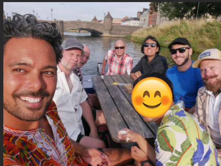
Den 3 augusti åkte vi på båt under tre timmar på Malmös kanaler för att samtala kring dating och skillnaden i att dejta med hiv från då och nu. Aktiviteten var en del av den serie av insatser vi gjorde under året för gruppen MSM 50+ som lever med hiv. Vi åt smörgåstårter under färden och hade med en låda med lappar där varje deltagare fick plocka en lapp med ett påstående och koppla det till sig själv. Med turen följde många skratt och nya deltagare kom att bli återkommande besökare!