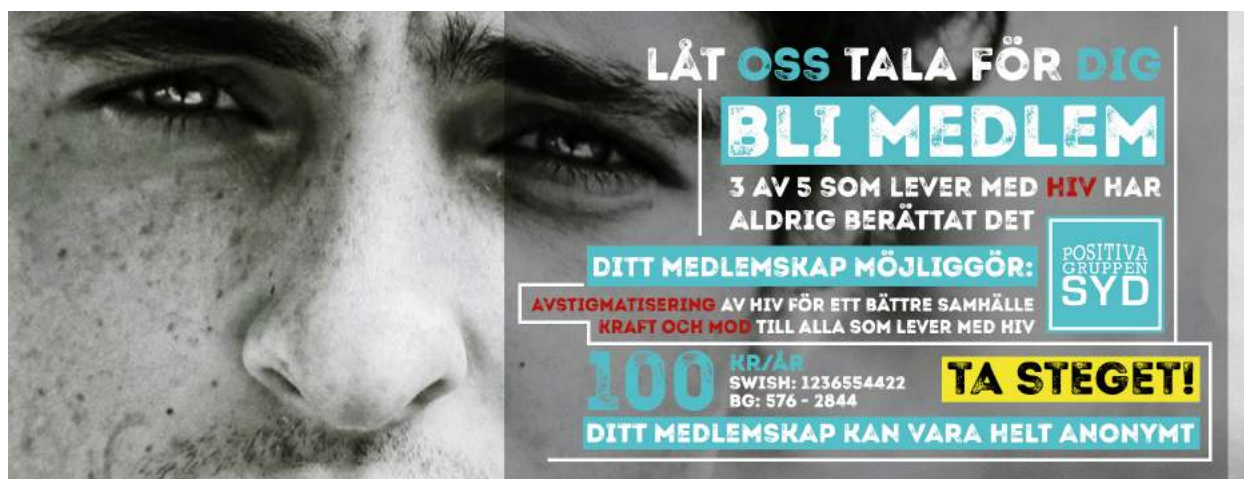
Ovan: Collage som började användas i slutet av 2019 för att upplysa om vikten av att bli medlem och vad ett medlemskap bidrar till.