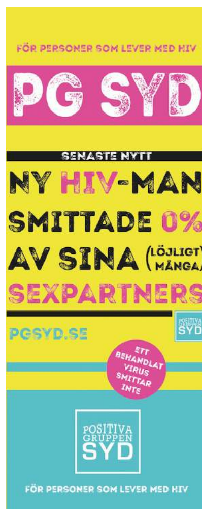
Ovan: Nya roll-up designs, roll-upsen anlände i början av 2020 och kommer att användas på event och arrangemang.